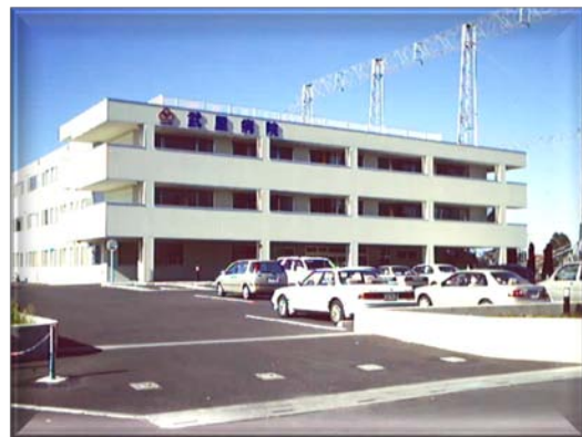
開院当時(平成14年撮影)

また、平成21年12月1日より認知症疾患医療センターとして、埼玉県より指定を受け、更なる地域の保健医療水準の向上に努めてまいります。